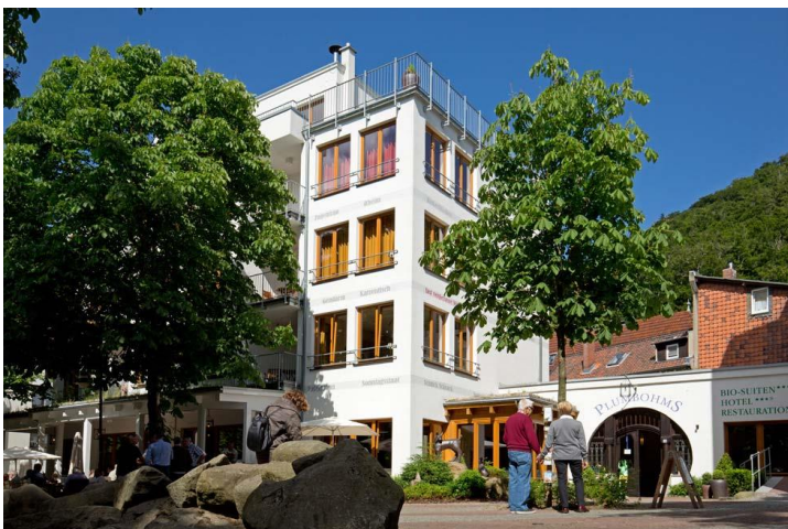
Das Plumbohms in der